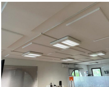
Pannelli distanziati a soffitto.