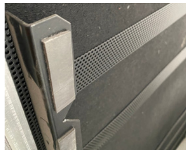
Sistema di fissaggio.